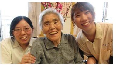
(左)大谷ケアワーカー (右)今ケアワーカー