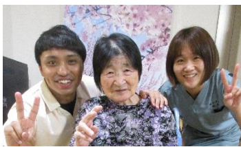
(左)星沢ケアワーカー (右)相馬機能訓練員